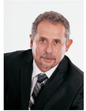
Mgr. Václav Horáček

Přijďte nás podpořit v mimořádných volbách do Poslanecké sněmovny ve dnech 25. a 26. října 2013.