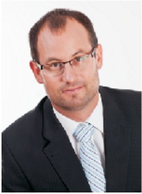
Mgr. Jan Farský

Přijďte nás podpořit v mimořádných volbách do Poslanecké sněmovny ve dnech 25. a 26. října 2013.