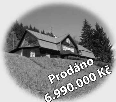
Horská chata Diana Krkonoše

Expresní prodej a pronájem Vaší nemovitosti za maximální ceny! Movitá klientela zejména z Prahy, ale i ciziny – záruka vyšší ceny! Výkup nemovitostí v Krkonoších a Jizerských horách – peníze ihned!