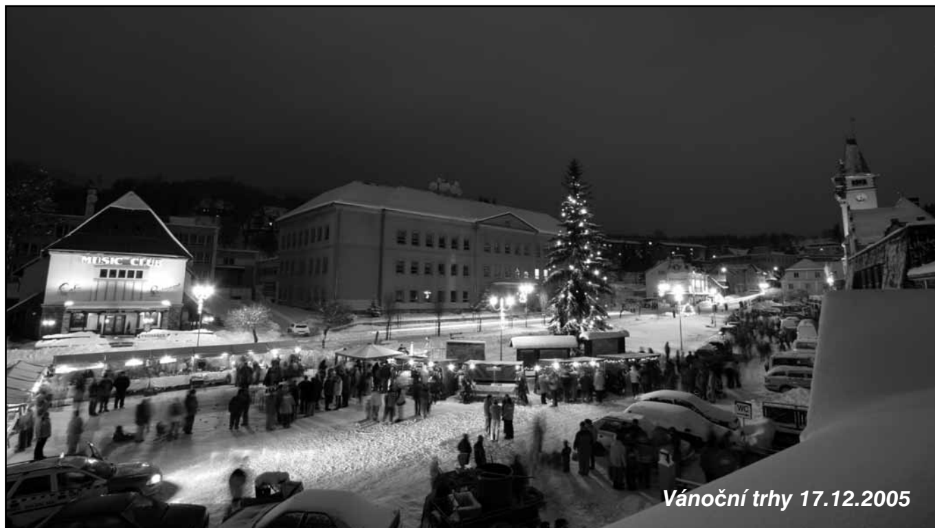
Vánoční trhy 17.12.2005