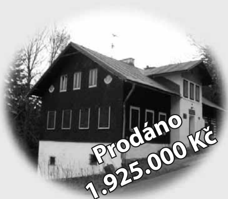
Horská chata Dolní Maxov Jizerské hory

Eurorealitní www.eurorealitni.cz agentura