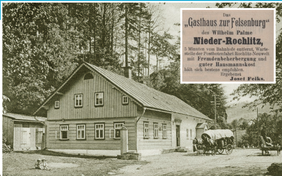
Gasthaus zur Felsenburg, Nieder-Rochlitz i. Riesengeb.