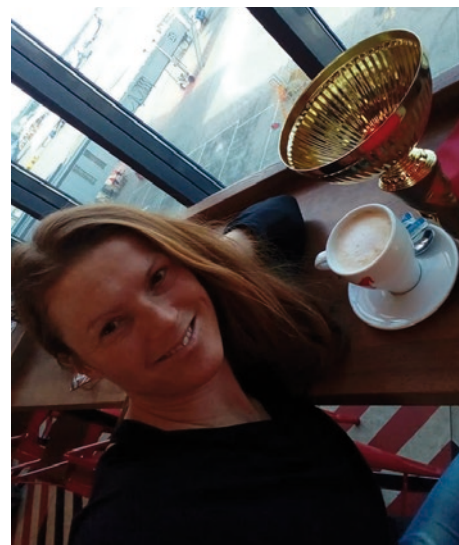
Letiště v Moskvě - cesta zpět s pohárem

Článek napsala: Mgr. Pavlína Herberová, dne 24. 3. 2019 v Liberci