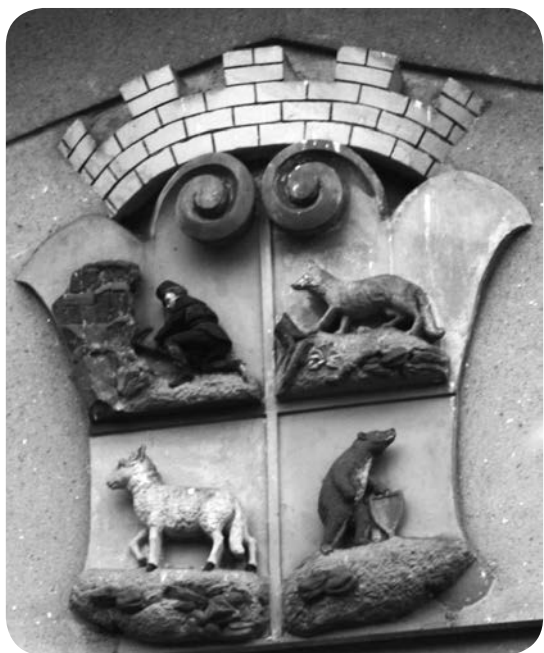
Znak Rokytnice nad Jizerou na škole