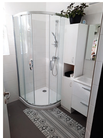
Nová koupelna a WC v MŠ Dolní