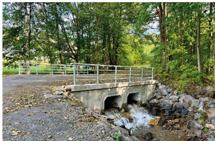
Oprava lyžařské cesty