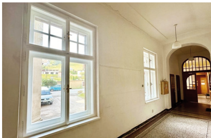
Nová okna v budově radnice