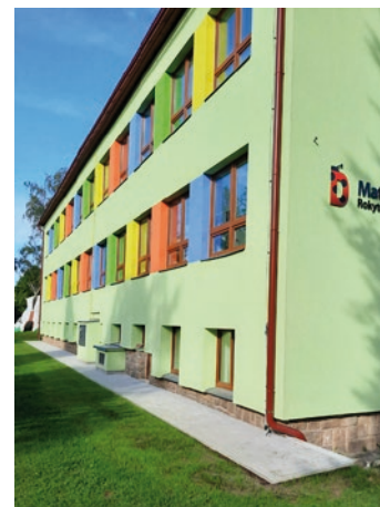
Obnova chodníčku u MŠ Dolní