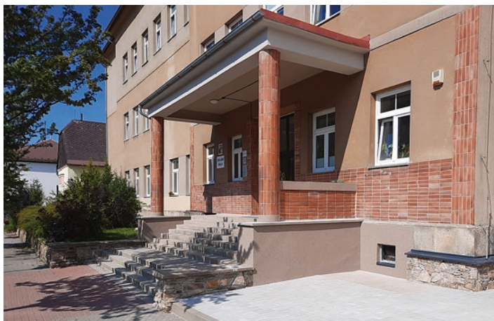
Vchod do Základní školy