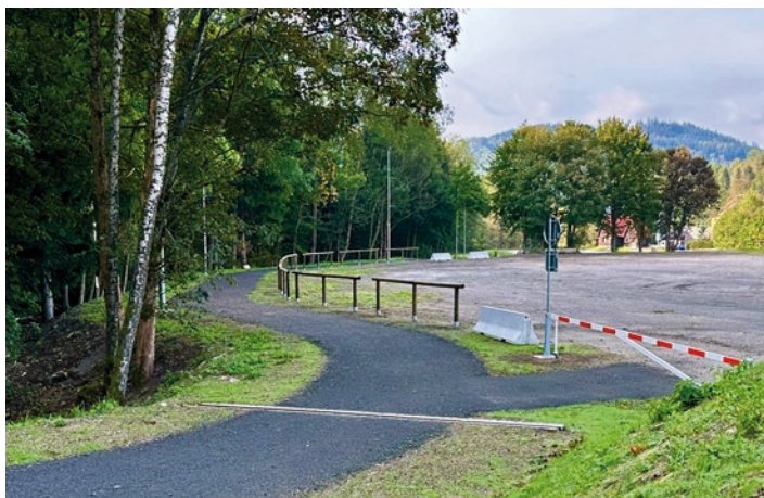
Oprava lyžařské cesty