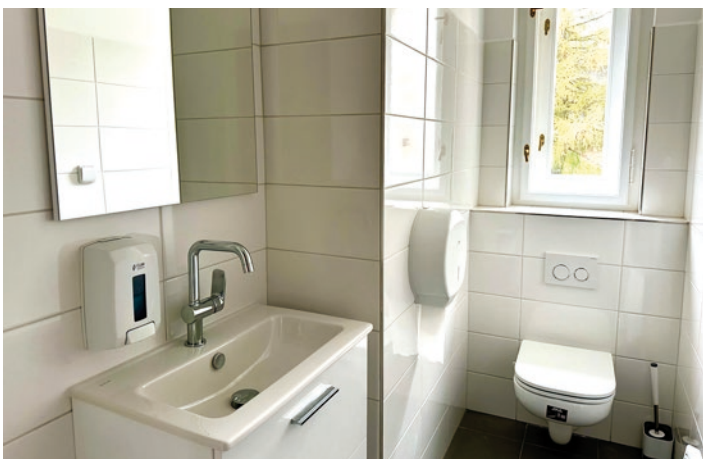
Rekonstrukce hygienického zázemí na radnici