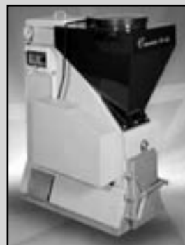
EKOEFEKT - 24kW pro Váš dům