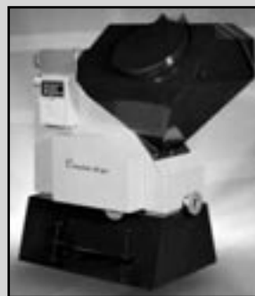
EKOEFEKT - 48kW pro Váš dvojdomek