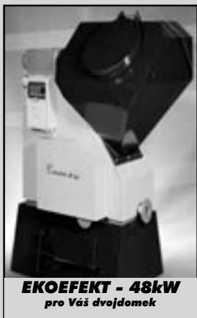
EKOEFECT - 48kW pro Vás dvojdomek