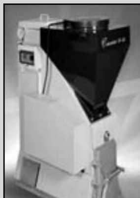
EKOEFECT - 24kW pro Vás dům