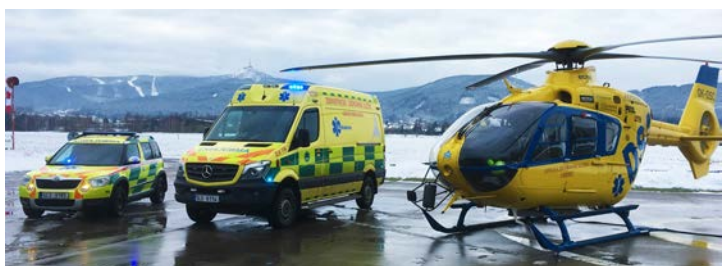
ZDRAVOTNICKÁ ZÁCHRANNÁ SLUŽBA LIBERECKÉHO KRAJE 2017

Naše motto je: „Milujeme život. Bojujeme o něj každý den. Na zemi, ve vzduchu, bezdrátově.“ Přejeme vám, abyste nás v životě nepotřebovali. Pokud nás potřebovat budete, budte připraveni.