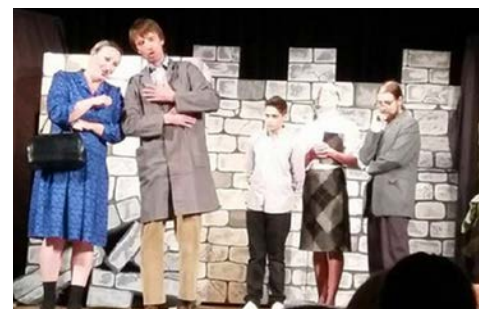
DS Mladá Haluz Desná