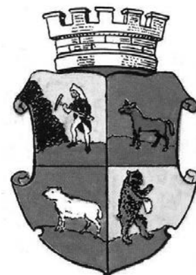
Vyobrazení znaku Rokytnice nad Jizerou v obřadní síni radnice

Mimořádné zpodobnění rokytnického znaku je na deskách tzv. Pichlerovy kroniky z roku 1991. Velice zjednodušující kresba figur přináší mimořádnou a dosud nebyvalou podobu horníka, který je v jakémsi příkřečeném postoji s mlátkem v napřáženém levé (sic) ruce a s želízkiem přiloženým ke skále v pravé ruce. Ve všech polích chybí trávník. Medvěd je otočen doprava a v levé tlapě drží něco neidentifikovatelného. Na štítě je hradební koruna a z ní okolo boků štítu splyvají akantové rozviliny, inspirované příkrývadly u rodových erbů. Zde jsou zcela zbytečné. Tato podoba znaku není nijak určující a je jen dokladem o vnímání podoby rokytnického městského znaku v prostředí vystěhovalců v Německu. Je škoda, že „Pichlerova kronika“ nepřináší žádné sfragistické a ani heraldické informace, které by osvětlily vznikání pečeti a nakonec i znaku.