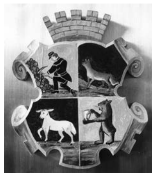
Vyobrazení znaku Rokytnice nad Jizerou v obřadní síni radnice

Vyobrazení znaku Rokytnice nad Jizerou v Čarkově publikaci je dílem grafika Stanislava Valáška. O zdroji a předloze nelze říci nic konkrétního. Hradební koruna na štítě a první pole štítu je poplatné plastice znaku na školní budově. Medvěd naopak neodpovídá ani pečeti a ani plastice na škole resp. na radnici. Je neobvykle otočen doprava a předmět, který na obou zmíněných místech je možné pojmenovat štítkem, je zde nakreslen jako radlice a je tak i popisem znaku pojmenován, byť s nejistotou a relativizujícím způsobem, za použití slova „patrně“. Oproti „žánrovému“ vyobrazení znaku na radnici i na škole, se Valášek pokusil o „heraldický“ umírněnější pojetí. I tak je zřejmé, že mu chyběla zkušenost s heraldickou kresbou – například tím, že ve zlatých polích je zelený trávník tmavší od téhož v polích modrých. Valášková kresba rokytnického znaku byla inspirací pro jeho vyobrazení v obřadní síni radnice. Zde byl poněkud neuměle vymalován do plochy bohatě členěného rolverkového štítu dřevěné vyřezávané plastiky.