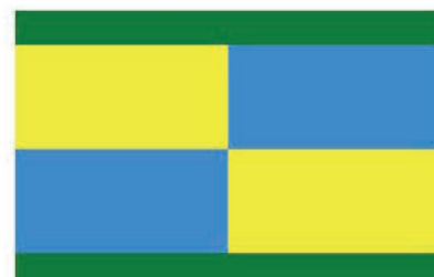
Návrh vlajky č. 5