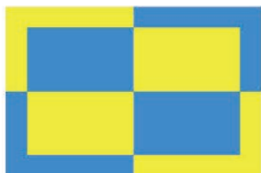
Návrh vlajky č. 2