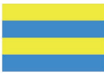
Návrh vlajky č. 4

Anketní lístek vyplňte nejpozději do 31. 3. 2015 a odevzdejte ho kdykoliv v pracovní době na Městském informačním centru, Horní Rokytnice 197, Rokytnice nad Jizerou (boční vchod radnice). Anketní lístek můžete vyplnit i elektronicky. Odkaz na elektronický dotazník je umístěn na úvodní straně webových stránek města www.mesto-rokytnice.cz .