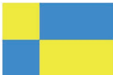
Návrh vlajky č. 3