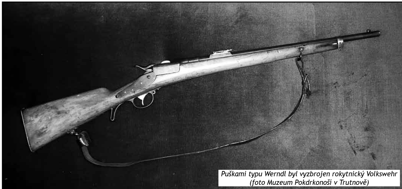
Puškami typu Wernld byl vyzbrojen rokytnický Volkswehr

Za situace, kdy se hroutila moc Deutschböhmen nad jedním městem za druhým rezignovali i Rokytničtí. Dopeled-