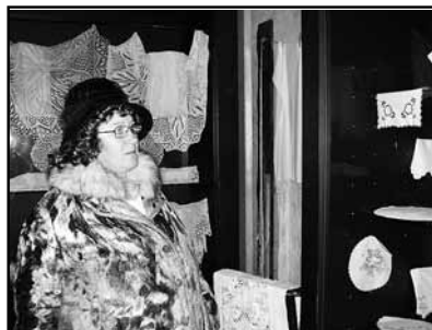
Kolektiv Starého kravína

Přejeme krásné Vánoce a hodně štěstí, zdraví v novém roce a těšíme se na Vaši návštěvu.