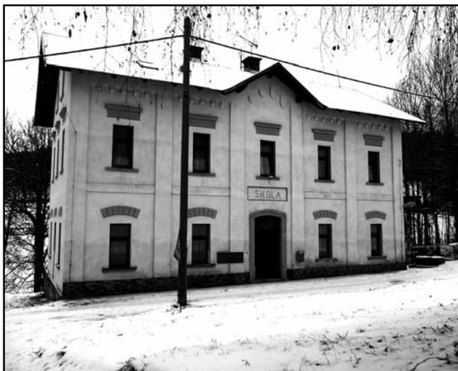
Dnešní vzhled někdejší budovy německé a české obecné školy ve Františkově

V roce 1933 se učitel Hermoch ve svých zápiscích zmiňuje o dokončení elektrifikace Františkova. Ve škol. roce 1933/34 zase připomíná stavbu školní tělocvičny v místě zvaném Kočvarka, kde se v létě již stabilně pořádaly poutě. Stavební úpravy v tělocvičně probíhaly i v následujícím škol. roce.