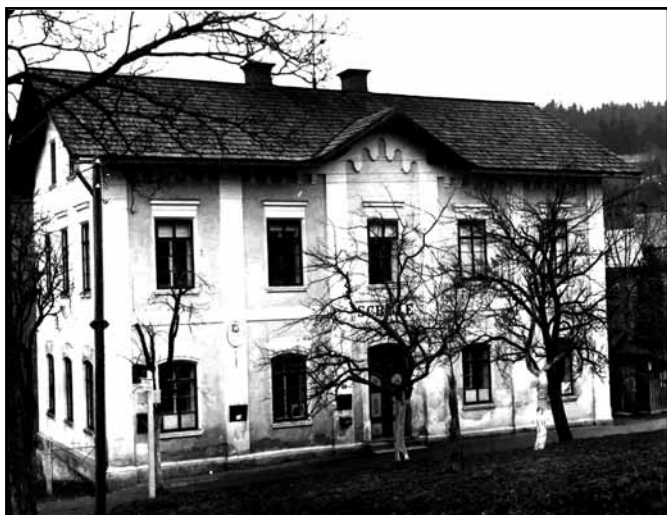
Na fotografii ze 30. let 20. století je zobrazena budova německé obecné školy ve Františkově, v jejímž přízemí tehdy sídlila česká obecná škola