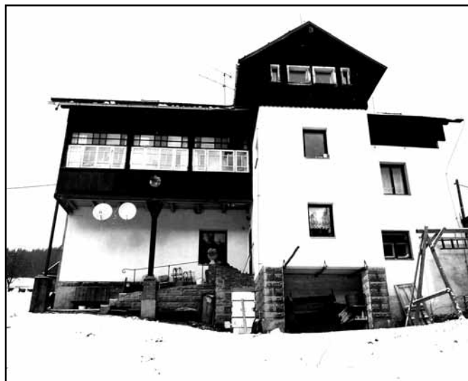
Dnešní vzhled zadní části domu čp. 56 ve Františkově, kde před 80 lety sídlila česká měšťanská škola