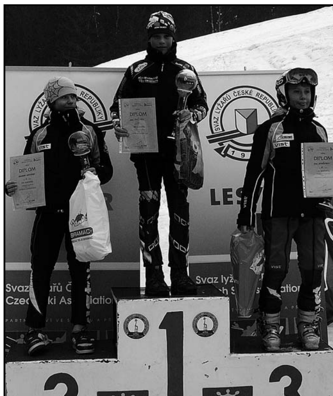
Finále VIST CUP - Krkonošský pohár 2009. ve Špindlerově Mlýne, sjezdovka Stoh, 4. - 6. 4. 2009