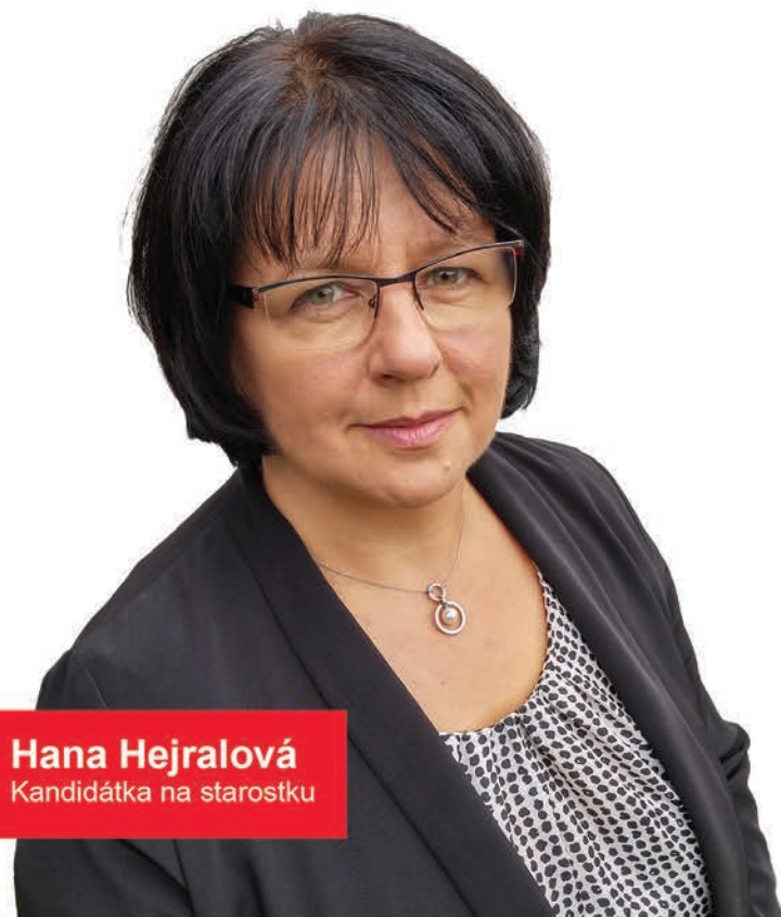
Hana Hejralová Kandidátka na starostku