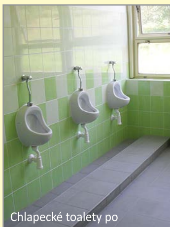
Chlapecké toalety po