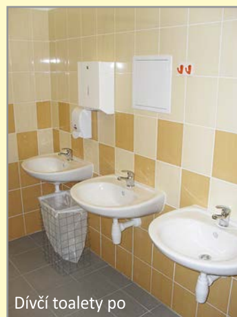
Dívčí toalety po

celé realizace byla křivost stávajících stěn. Některé úseky museli obkladači rovnat tzv. dohazováním. Musím uznat, že si dali opravdu záležet a výsledek vypadá velice dobře. Obklady jsme vybrali veselé a barevné - pro kluky zelené, pro holky okrové. Celá rekonstrukce se stihla ve sjednaném termínu a v dostatečném předstihu před začátkem nového školního roku.