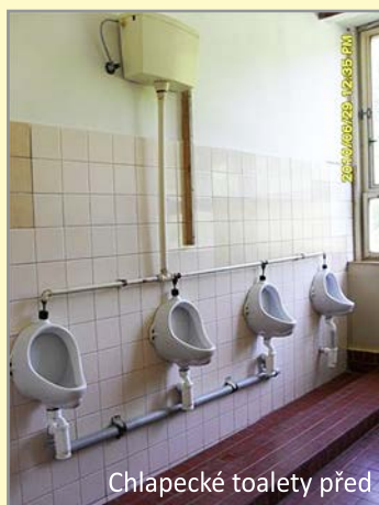
Chlapecké toalety před

V pátek 30. 6. dostali žáci vysvědčení a vesele se rozutekli ze školy vstříc dvěma měsícům volna. Naopak pracovníci firmy DI-TECH začali do školy navážet stavební materiál, aby se co nejdříve pustili do práce a vše se stihlo do konce prázdnin. Nejprve bylo třeba odstranit staré obklady a dlažby a zkontrolovat stávající rozvody vody a kanalizace. Staré ocelové kóje na dívčích toaletách byly nahrazeny novými zděnými příčkami, přičemž byly zvětšeny tak, aby velikostně splňovali současné hygienické požadavky. Největším problémem