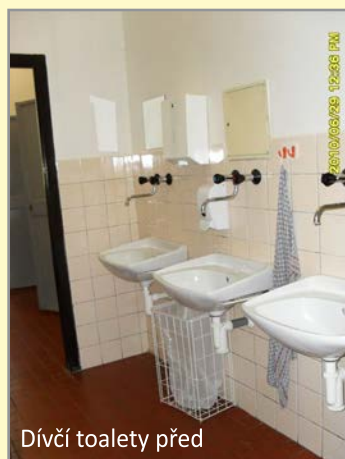
Dívčí toalety před