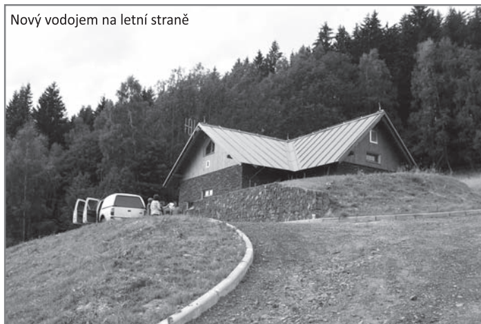
Nový vodojem na letní straně

Předmětem stavby byla tedy výstavba kanalizace v celkové délce 14 635,9 m v profilech DN 250 - 300 včetně 1 483,5 m veřejných částí kanalizačních přípojek, dále výstavba vodovodu v celkové délce 11 144,0 m v profilech DN 80 - 160 včetně 933,0 m veřejných částí vodovodních přípojek, výstavba 2 nových vodojemů v Dolní Rokytnici na Letní a Zimní Straně o akumulaci každé 2 × 100 m 3 , rekonstrukce čerpací stanice pitné vody v Dolní Rokytnici. Součástí stavby byla rekonstrukce 5 stávajících mostů, výstavba 1 opěrné zdi, dále přeložky stávajících inženýrských sítí. Při stavbě byly obnoveny povrchy dotčených komunikací v celé šíři.