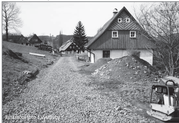
Ilustrační foto z výstavby

Projekt spočíval ve vybudování nových stokových sítí s oddělením splaškových a dešťových vod, včetně napojení na stávající kanalizaci a celého systému odvádění splaškových vod na centrální ČOV. Dobudování kanalizační sítě pozitivně ovlivnilo provoz stávajícího kanalizačního systému, včetně funkce a účinnosti ČOV, a především zajistilo zlepšení kvality povrchových vod povodí Jizery, což bylo hlavním účelem projektu Čistá Jizera. Dále byla v Rokytnici nad Jizerou řešena i kvalita a zásobování pitnou vodou výstavbou vodovodních řadů včetně 2 nových vodojemů a rekonstrukce čerpací stanice pitné vody.