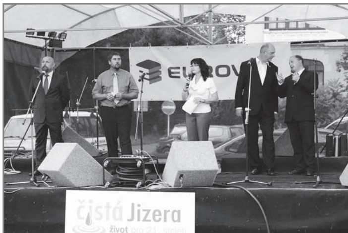
Slavnostní zakončení v Rokytnici nad Jizerou 17. 9. 2011