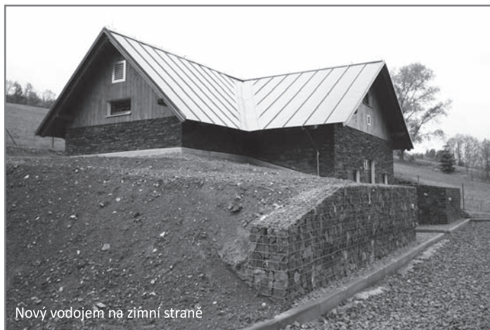
Nový vodojem na zimní straně

Předmětem stavby byla tedy výstavba kanalizace v celkové délce 14 635,9 m v profilech DN 250 - 300 včetně 1 483,5 m veřejných částí kanalizačních přípojek, dále výstavba vodovodu v celkové délce 11 144,0 m v profilech DN 80 - 160 včetně 933,0 m veřejných částí vodovodních přípojek, výstavba 2 nových vodojemů v Dolní Rokytnici na Letní a Zimní Straně o akumulaci každé 2 × 100 m 3 , rekonstrukce čerpací stanice pitné vody v Dolní Rokytnici. Součástí stavby byla rekonstrukce 5 stávajících mostů, výstavba 1 opěrné zdi, dále přeložky stávajících inženýrských sítí. Při stavbě byly obnoveny povrchy dotčených komunikací v celé šíři.