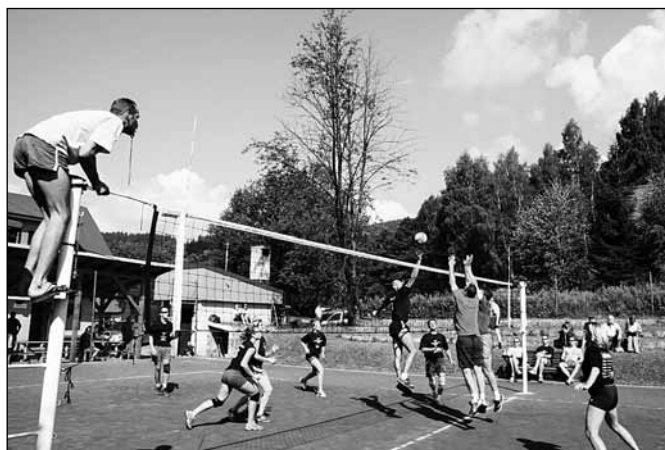
ilustrační foto – Rokytnické volejbalové dny 2005