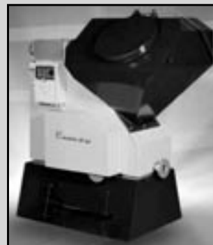
EKOEFECT - 48kW pro Váš dvojdomek