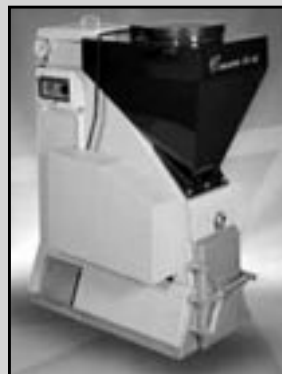
EKOEFECT - 24kW pro Váš dům